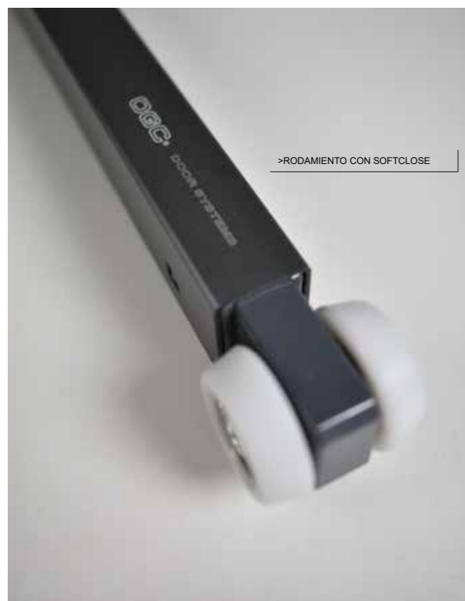
>RODAMIENTO CON SOFTCLOSE