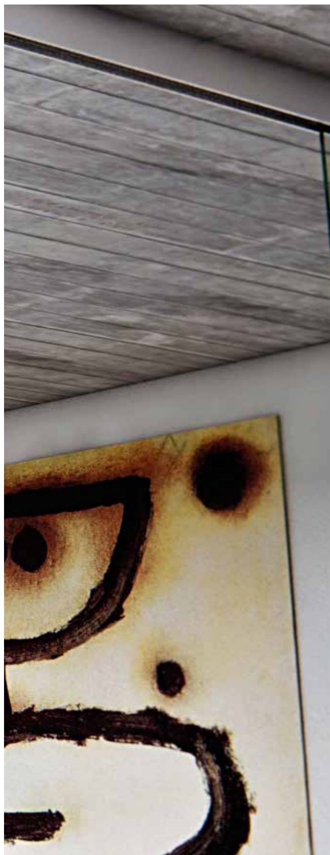
13.158405.04 TAPETA FRONTAL PLATA MATE FRONT COVER SILVER MATTE