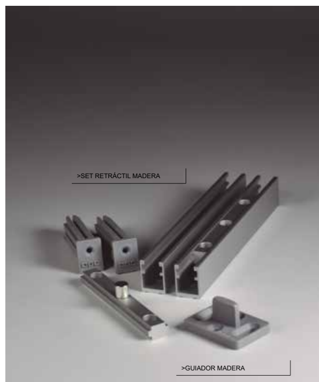
>SET RETRÁCTIL MADERA