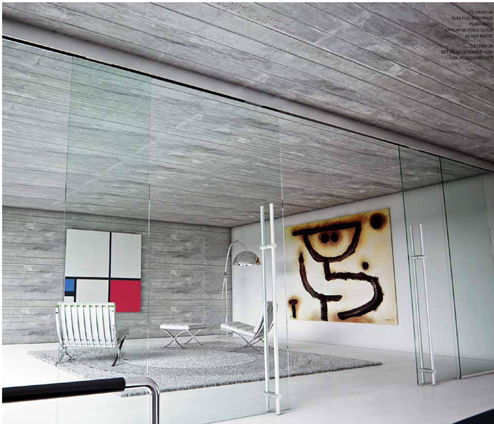
13.158305.04 GUÍA FIJO EPROM125 PLATA MATE EPROM125 FIXED GUIDE SILVER MATTE 13.E12500.04 SET DE ACCESORIOS 125K 125K ACCESSORY SET